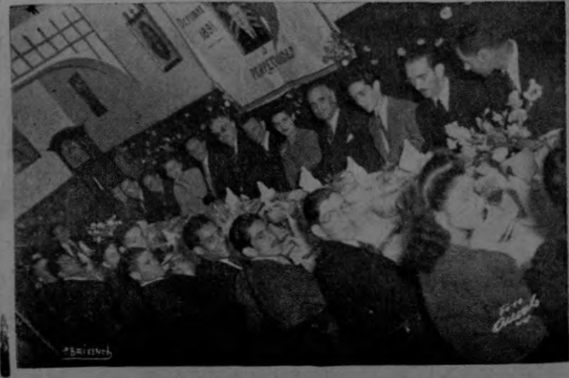
Un aspecto del salón-comedor, el que se encontraba engalvanado con banderas y retratos de los fundadores de las Esc. Int.