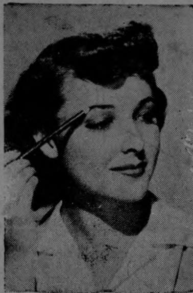
Las estrellas de Hollywood—como la encantadora LARRAINE DAY, de Paramount—saben apreciar el valor de un maquillaje perfecto en todo detalle, y también saben el mal efecto que causa ver una mujer maquillarse en público. Sobre este tema, trata Max Factor Jr. en su crónica de hoy.

En esta crónica hemos apuntado repetidas veces que ninguna mujer puede lucir "glamorous" mascando chicle. En lo que a la belleza respecta, la boca de una mujer debe estar en reposo cuando ella no está hablando.